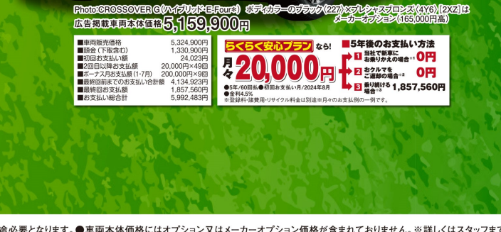
Photo: CROSSOVER G (ハイブリッドE-Four) ※デカカラーのブリック(22)・シルシスブロンズ(4Y6) [2X2] は 広告掲載車両本体価格5,159,900円