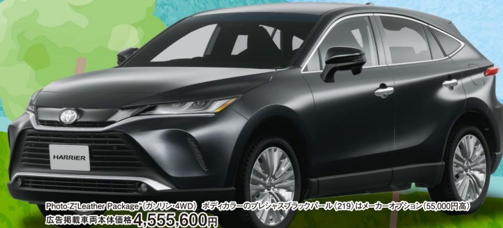
Photo: Z Leather Package (ガソリン4WD) ※デカカラーのシルシスブラックパール(219) はメーカーオプション(65,000円高) 広告掲載車両本体価格4,555,600円