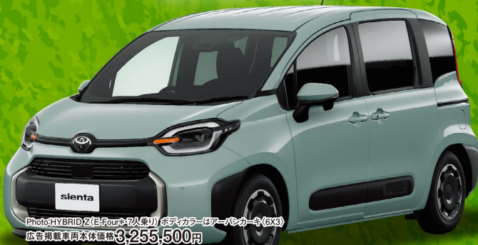
Photo: HYBRID Z (E-Four全7人乗り) ※デカカラーはアーバンカーキ(6X3) 広告掲載車両本体価格3,255,500円