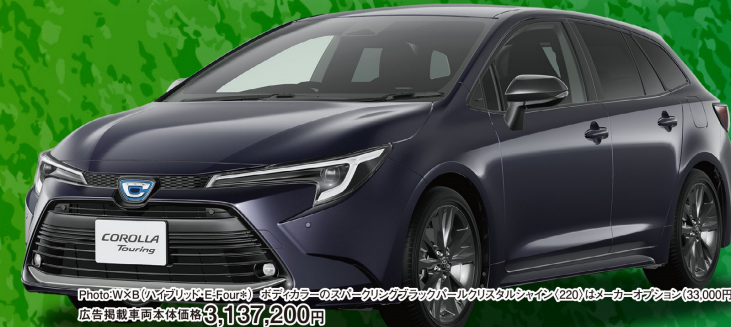
Photo: WX B (ハイブリッドE-Four) ※デカカラーのスーパーステアリングブラックパールメタリックシャイン(22) はメーカーオプション(33,000円高) 広告掲載車両本体価格3,137,200円