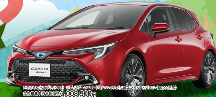
Photo: GZ (ハイブリッドF) ※デカカラーのワゴ・シヨナルレッド(8U9) はメーカーオプション(65,000円高) 広告掲載車両本体価格3,008,900円