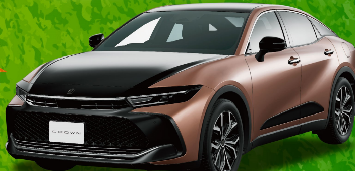
Photo: CROSSOVER G (ハイブリッドE-Four) ※デカカラーのブリック(22)・シルシスブロンズ(4Y6) [2X2] は 広告掲載車両本体価格5,159,900円